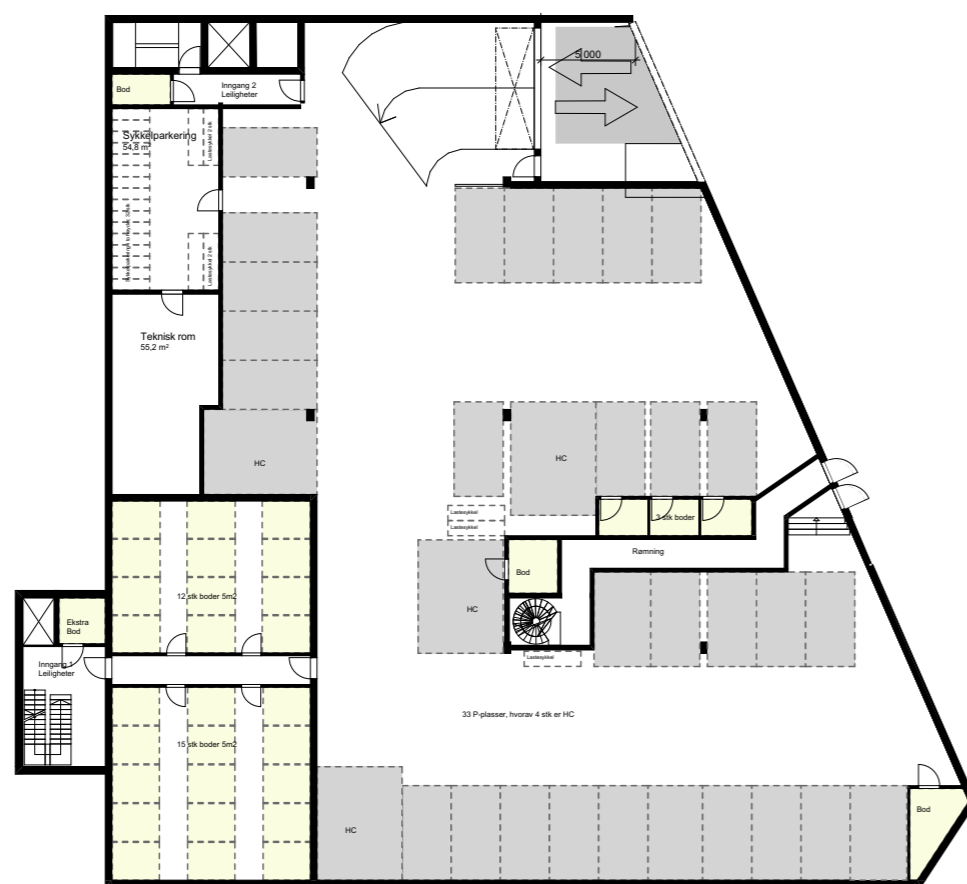
1:400 U. etasje

33 P-plasser i kjeller (1P pr. leilighet) + ca. 18 p-plasser på terreng som er felles for formål bolig/forretning/kontor/servering/tjenesteyting. I tillegg reguleres det inn ca. 11 offentlige p-plasser.