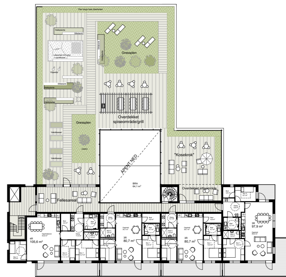
1:400 5. etasje