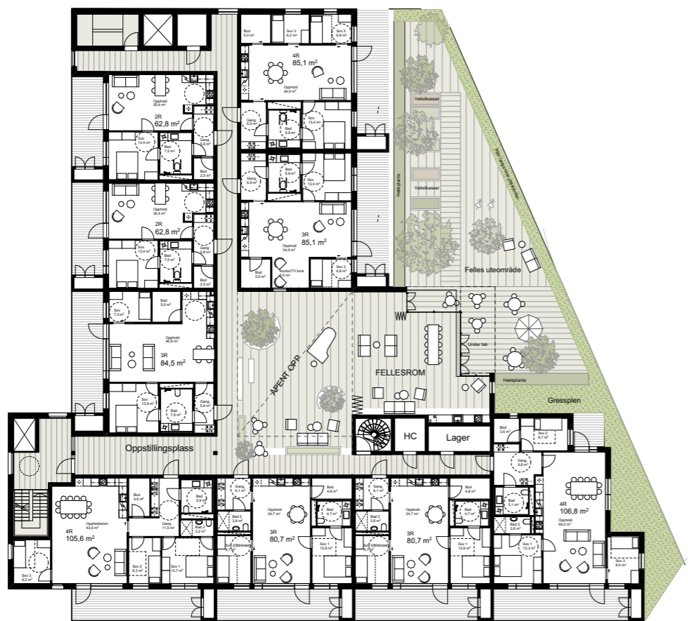
1:400 2. etasje