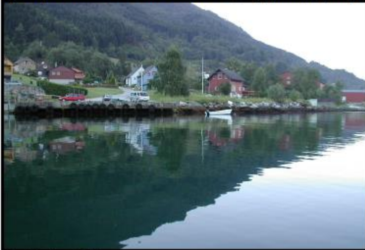
Område til småbåthamn

Det kan leggest til rette for mindre båtar. Småbåthamna vert bygd opp med ein enkel kaikonstruksjon. Eksisterande kai er i dårleg forfatning. Det må til eit omfattande reparasjonsarbeid eller kaia må rivast og byggast opp på ny.