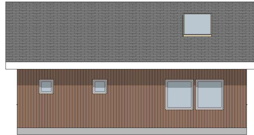
1:100 Fasade Øst