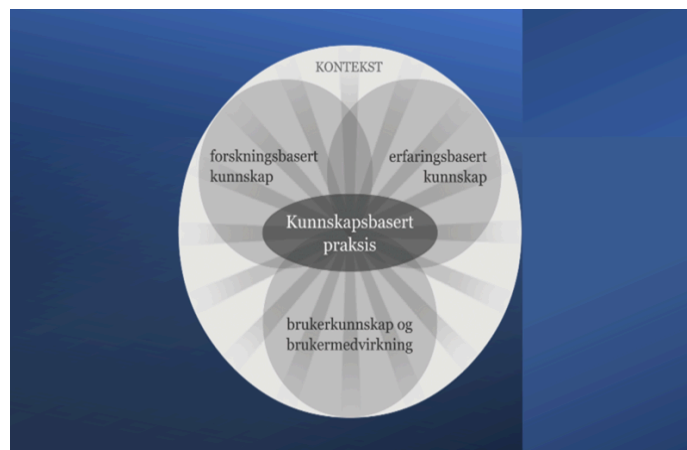
Fig. xx Kunnskapstriangelet

Eit stadig viktigare prinsipp for utvikling, er innbyggjarinvolvering. Kunnskapsutvikling gjennom medverknadsprosessar og samskaping mellom forskingsmiljø, tilsette og innbyggjarar/brukarar er i aukande grad eit prinsipp som skal liggja til grunn for utvikling av fagleg praksis.