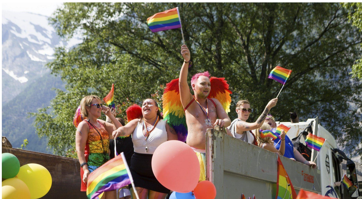
Tysso Pride ble arrangert for fyrste gong i 2020. I Ullensvang skal alle kjenna seg heime og inkludert, uavhengig av kjønnsidentitet og seksuell legning.