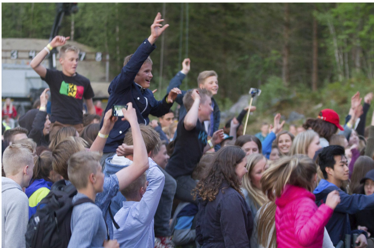
16.mai fest i Kinsarvik for ungdom frå heile Ullensvang kommune. Her får alle vera med!

Dette vil ikkje seia at alle arrangement og tiltak må kryssa av på alle punkt, men me ynskjer at alle skal ha ein gjennomtenkt politikk.