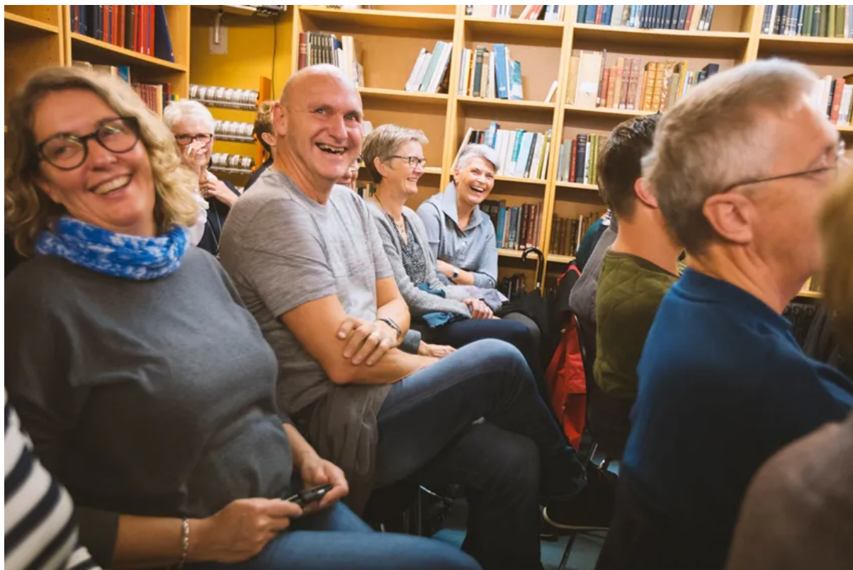
Fornøyeleg litterær terapitime i Hardangersamlinga, Odda bibliotek.