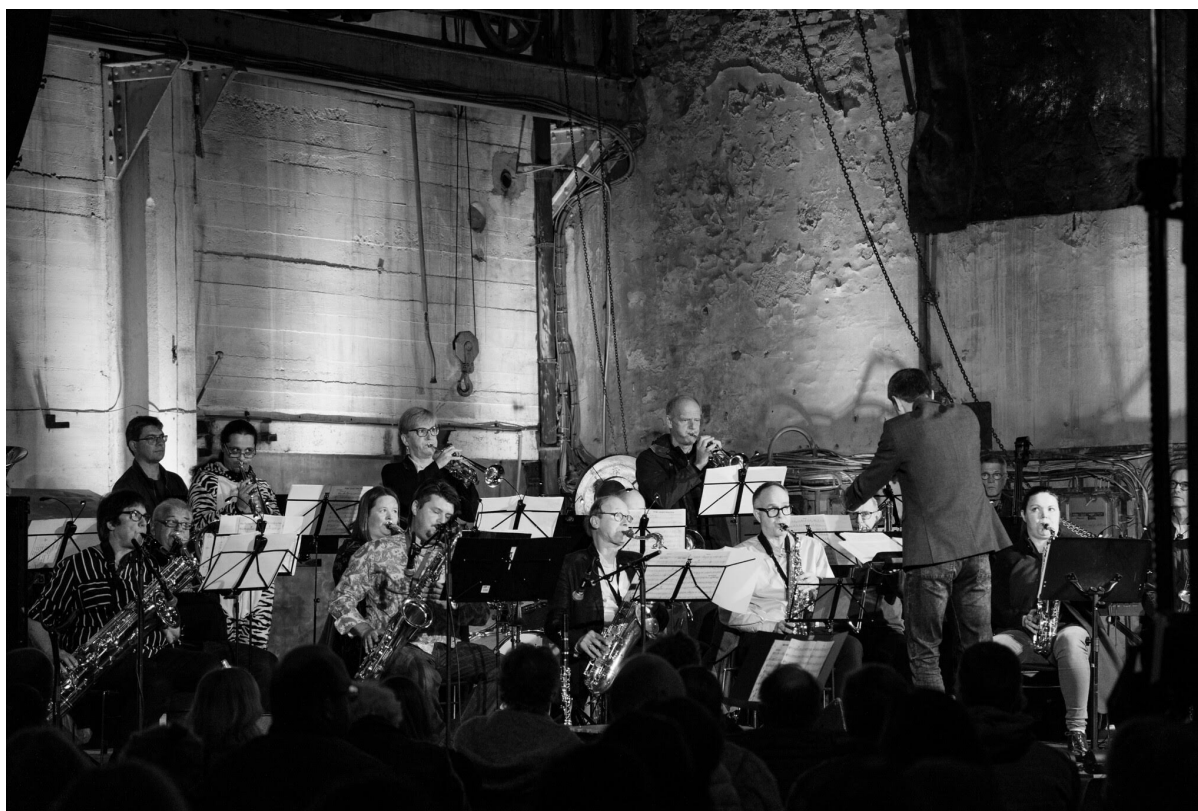
Smelteverket representerer unike arenaer for kulturopplevingar. Odda Storband i Lindehuset.