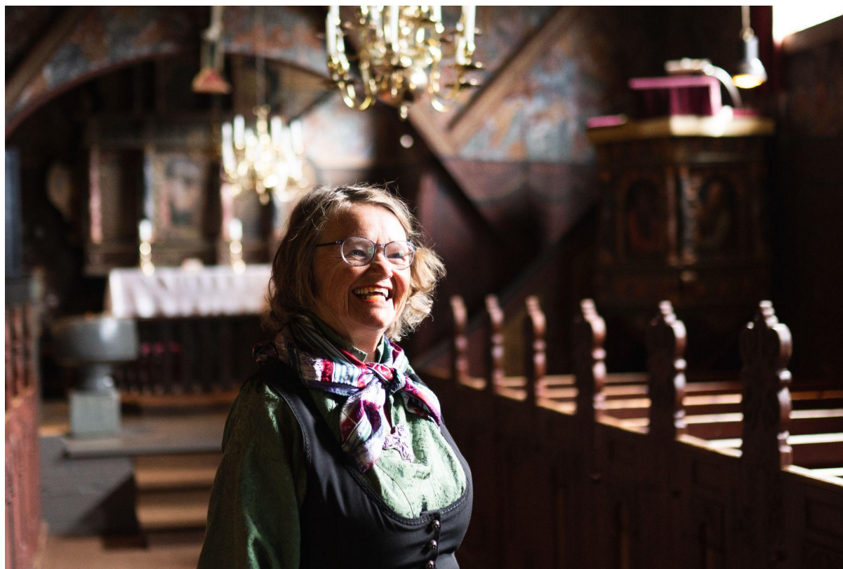
Røldal Stavkyrkje med det undergjerande krusifikset er eit kulturelt fyrtårn i kommunen.