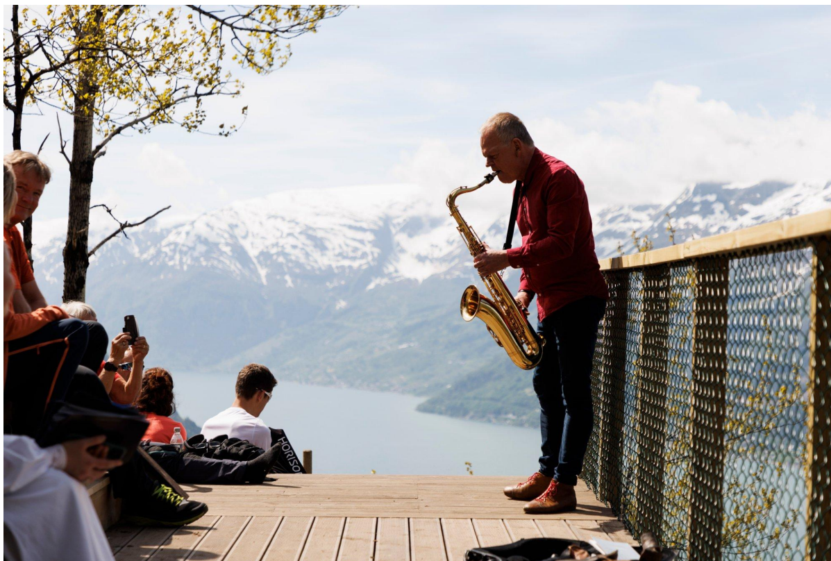
Stemningsfull stund mellom fjord og fjell når Hardanger Musikkfest har programslepp på dagsturhytta Hovdakruno.