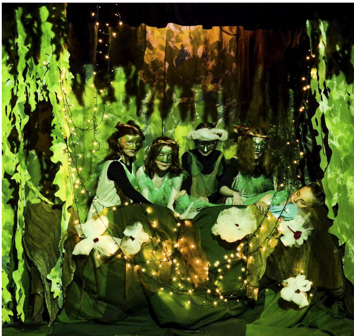
Ein midtsommarnattsdraum med dramagruppa i kulturskulen i Jondal.