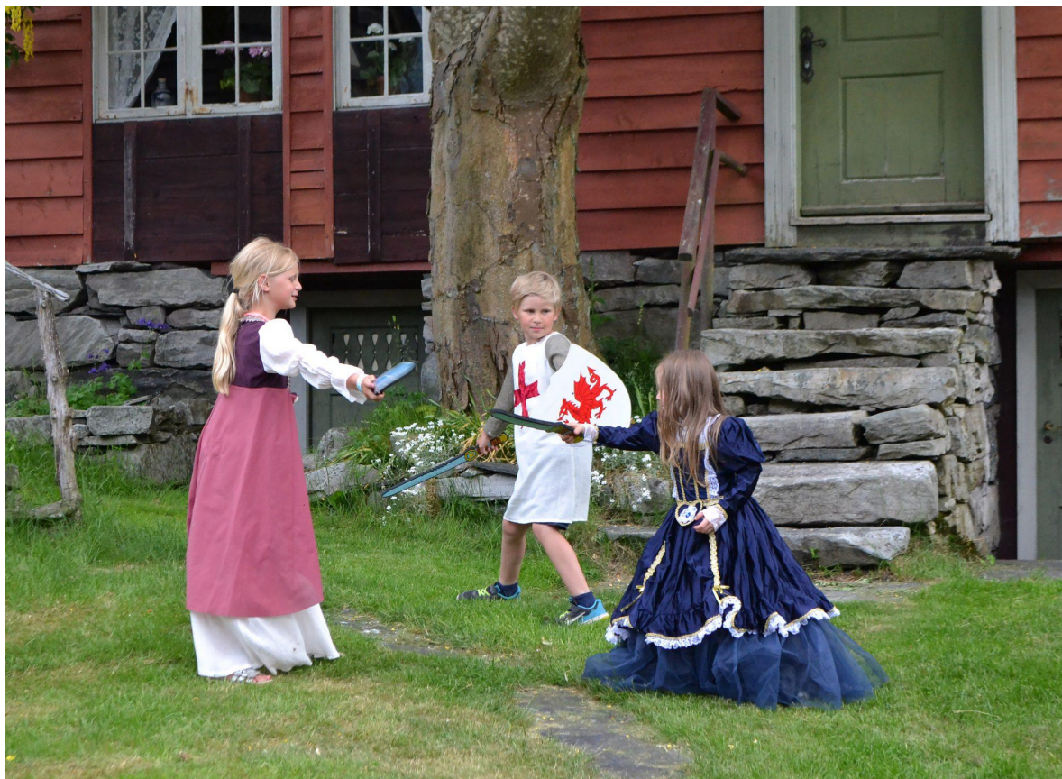
Agatunet er eit historisk maktsentrum med unik middelalderhistorie, og her foregår framleis ridderkamp mellom husa.

Ullensvang kommune har vedteke ein overordna samfunnsplan med mål, strategiar og tiltak. Temaplan for kultur vil konkretisera intensjonane i planen, men også foreslå mål til tiltak som me ikkje finn i planen, ettersom Kommuneplanens samfunnsdel har sine spesifikke hovudfokus.