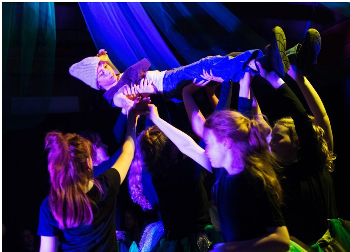
Den kulturelle grunnmuren kan lyfta oss inn i rike kulturmøte kor me enn er. Her frå Sirkus Peer ved dramagruppa Jondal.