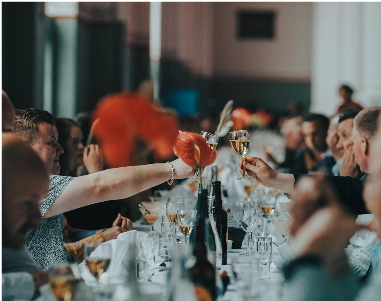
Festmiddag under Hardanger Internasjonale Siderfest i Tyssø 1.