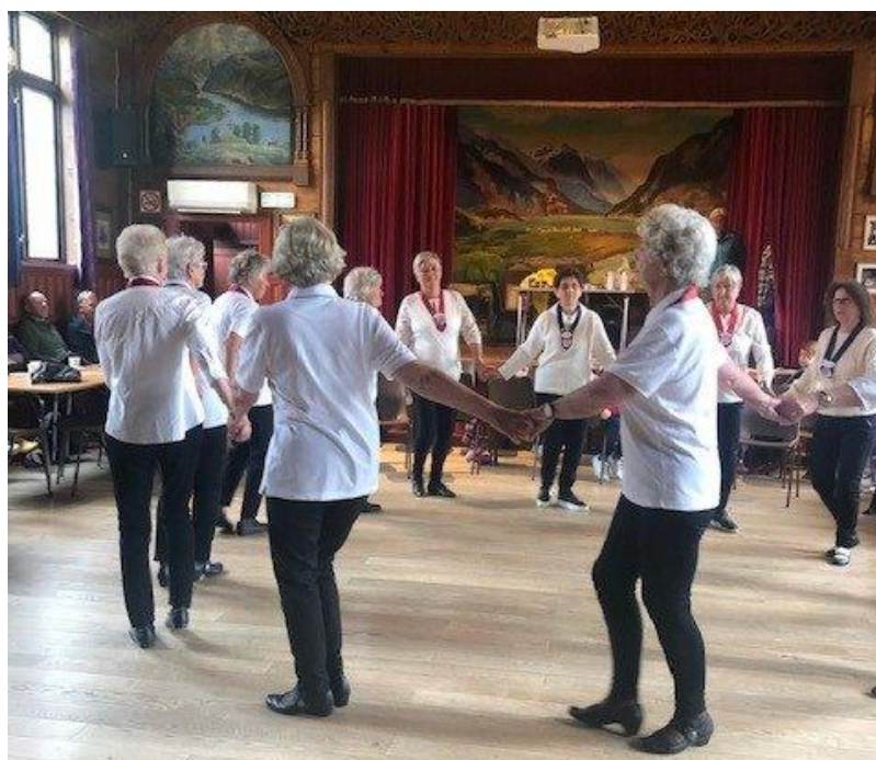
Feiring av Verdas aktivitetsdag for eldre i Ungdomshallen i Odda. Dans er fellesskap, glede og fysisk aktivitet.