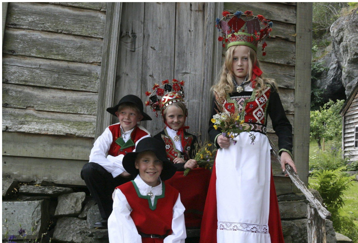
Tradisjonen med jonsokbrudlaup er unik immateriell kulturarv av internasjonal interesse.