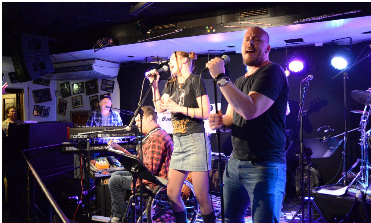
Fullt trøkk på Iris scene med både nasjonale og lokale stjerner.