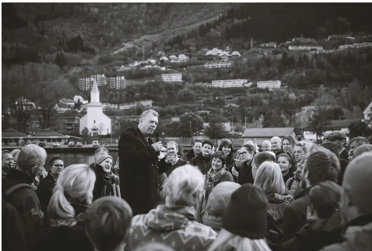
Bikubegang har vore den gjævaste programposten under Litteratursymposiet gjennom alle år. Her er det berre å henga med!

Temaplan for kultur skal gje mål og retning for arbeidet innan sektoren dei neste fire åra. Planen skal konkretisera aktuelle mål frå kommuneplanens samfunnsdel og visa korleis grunntanken om FN sine berekraftsmål også legg føringar for arbeid innan kultursektoren. Temaplanen er bindeledd mellom Kommuneplanens samfunnsdel og Økonomiplanen og skal visa konkret prioritering av tiltak i perioden. Planen vert også overordna fagplanar for t.d. bibliotek og kulturskule.