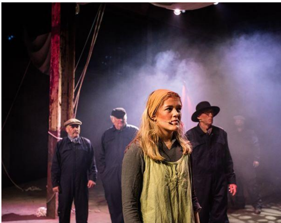
Den historiske musikalen Albert og Leonie er eksempel på vellukka samarbeid mellom profesjonelle, dyktige amatører og lokale talent.

Når innbyggjarane våre vert spurte om kva dei saknar i kulturlivet i Ullensvang, er det teater som toppar lista. Dette er naturleg, ettersom me ikkje har god nok scene til Riksteater og det ofte er dyrt og ressurskrevjande å ta imot teater. Det er svært gledeleg at Ullensvang kommune no er offisielt opna som spelestad for Teater Vestland, noko som vil gje oss større høve for å oppleve teater i eigen kommune. I tillegg er det eit satsingsområde at barn skal få oppleve teater av høg kvalitet, gjerne i regi av bibliotek/kino og DKS, og gjerne i samarbeid med barnehage/skule slik at tilbodet går til alle.