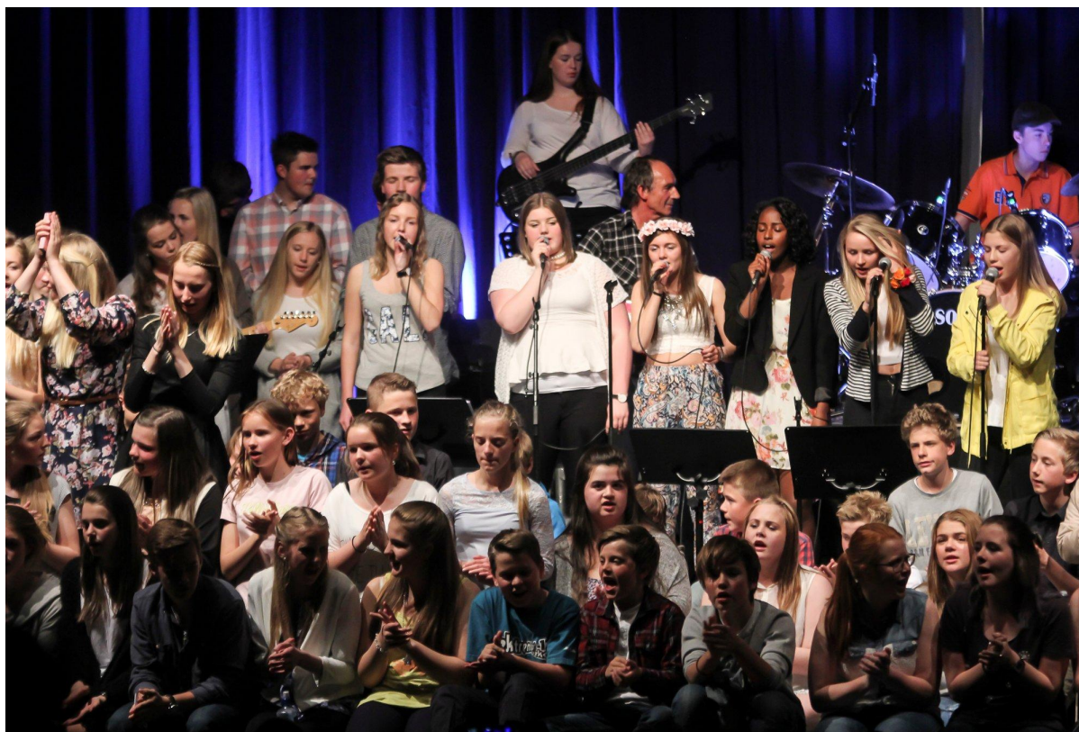
Skulekonsert for Odda ungdomsskole. Mangfald, fellesskap, samhald og identitet.